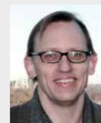
Erik Kärrman Urban Water Management, Beslutstöd i VA-planering